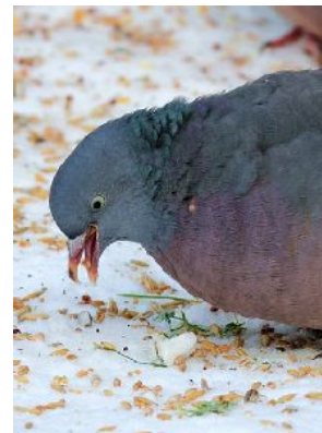
Jungtauben haben noch keinen weißen Halsring

Diese größte europäische Taube bewohnt offenes Gelände mit lichtigem Baumbestand, Parks, Gärten und Friedhöfe. Das etwas unordentlich wirkende Nest wird in Bäumen und Mauernischen gebaut, beide Partner brüten. Die Nahrung besteht zum großen Teil aus Getreide, Bucheckern und Eicheln, auch verschiedene Beeren und grüne Pflanzenteile werden verzehrt.