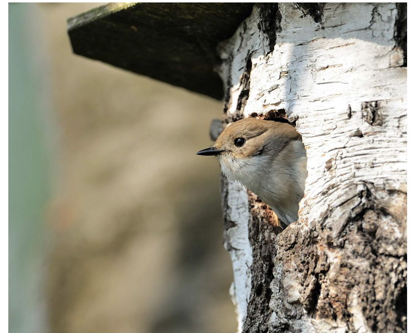
Auf allen Fotos ist ein weiblicher Vogel zu sehen

Entgegen anderer Schnäpper erbeuten Trauerschnäpper einen nicht unerheblichen Teil ihrer Nahrung am Boden, doch werden auch Insekten in der Luft gefangen.