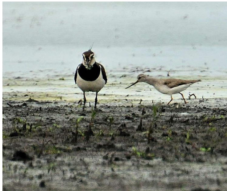
Größenvergleich mit einem Kiebitz