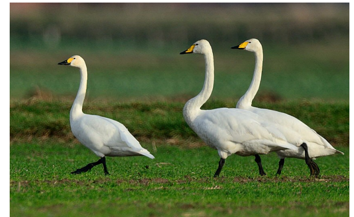
Zum Vergleich: Vorn ein Zwergschwan

In ihren skandinavischen Brutgebieten haben die Bestände der Singschwäne in den letzten Jahrzehnten wieder zugenommen. Bei uns überwinteren die Vögel teils mit Höckerschwänen im Bereich der Weser, dort ernähren sie sich von den jungen Rapspflanzen. In sehr geringen Stückzahlen gesellen sich hin und wider Zwergschwäne dazu.