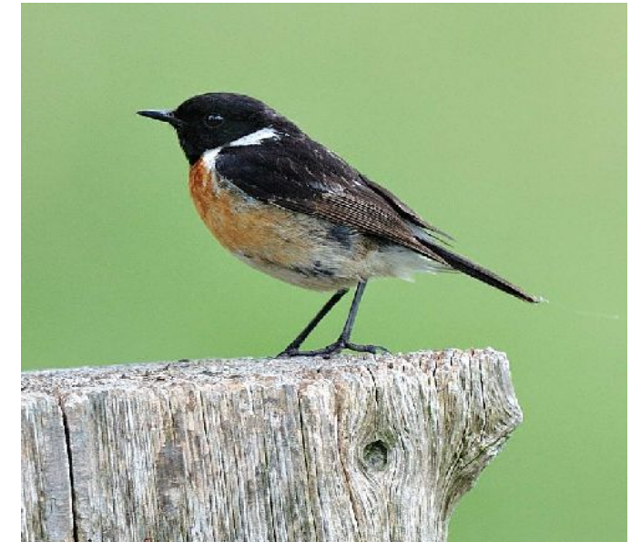
Oben Männchen, unten Jungvogel