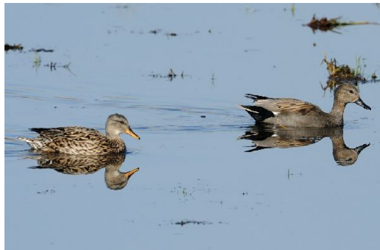
Links Weibchen, rechts Männchen