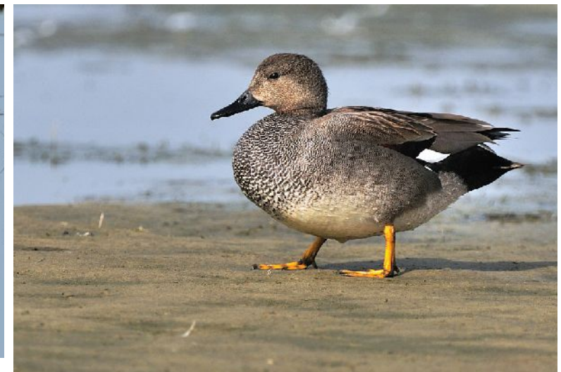
Oben Männchen, unten Weibchen