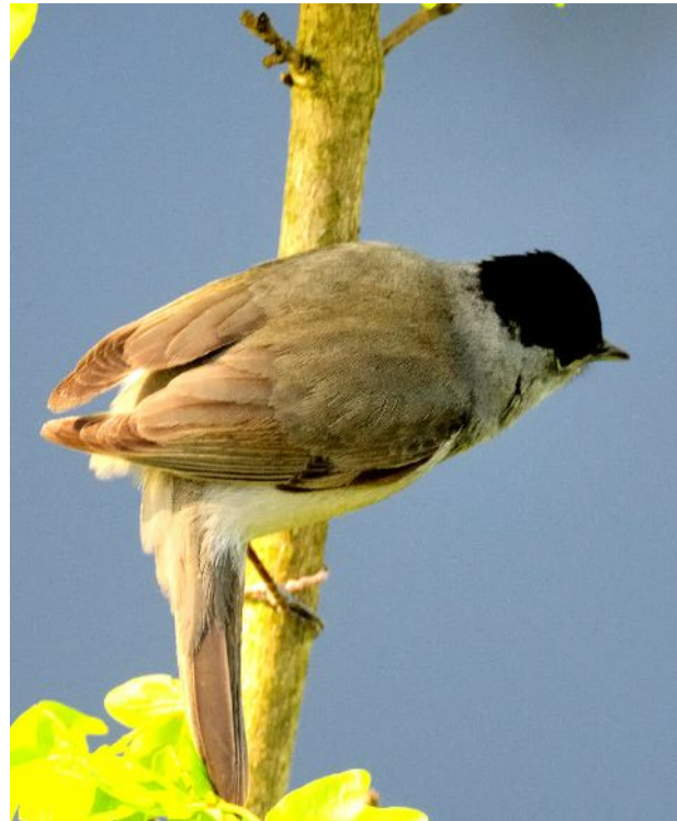
Auf allen Fotos: adultes Männchen

Diese sangesfreudige Grasmücke gehört zu den häufigsten Vögeln der Kulturlandschaft. Im Wald mit starkem Strauchbewuchs sind Mönchsgrasmücken ebenso zu finden wie in Parks und Gärten.