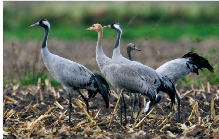
Ein Paar mit zwei Jungen, zu erkennen an der Braunfärbung