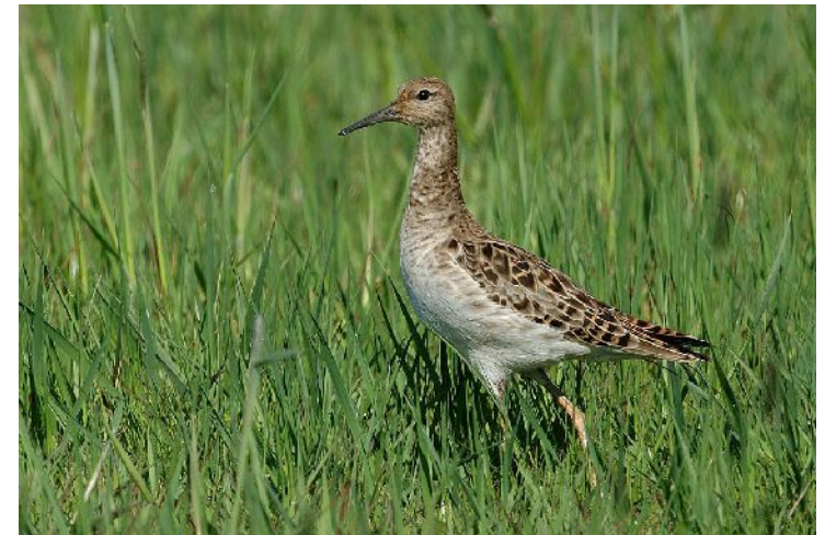
oben: Weibchen, unten: Männchen

Kampfläufer sind besonders interessante Vögel. Das Prachtkleid der Männchen kann sehr unterschiedlich aussehen. Im Hals- und Kopfbereich variieren die Federbüschel, die während der Balz aufgestellt werden, von schwarz über braun bis weiß. Gebalzt wird auf sogenannten Arenen, ähnlich wie es von Raufußhühnern bekannt ist.