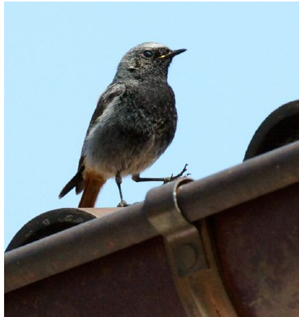
Mitte und oben: Männchen rechts: Jungvogel im ersten Jahr