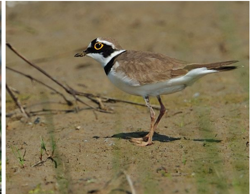
oben: Adulter Flussregenpfeifer unten: Jungvogel

Insekten, Würmer und Larven stellen den Hauptanteil der Nahrung. Im Flachwasser sind die Vögel dabei zu beobachten, wie sie durch Fußzittern Beute aufscheuchen.