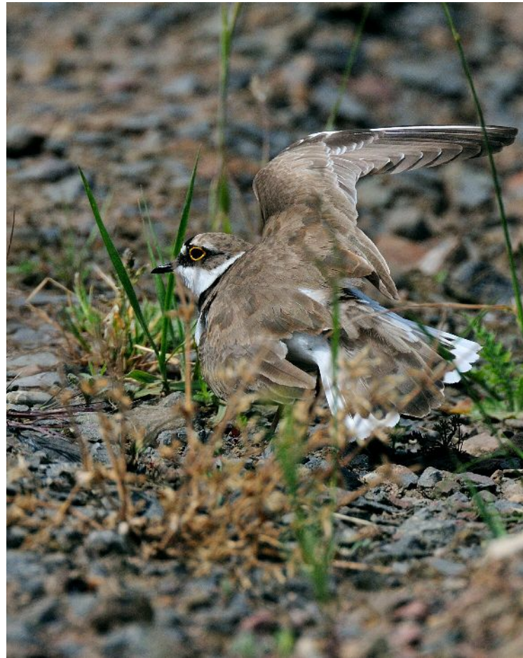
Bodenfeinde werden durch Verleiten von Nest oder Jungen abgelenkt

Nestflüchter, flugfähig mit 24 bis 29 Tagen